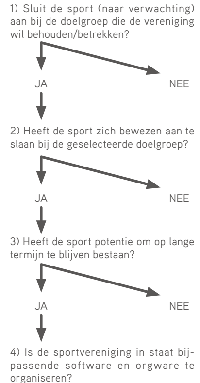
FIGUUR 1 BESLISBOOM OM IN NIEUW SPORTAANBOD TE INVESTEREN

trekkelijk te blijven en de vereniging toekomstbestendig te laten zijn.