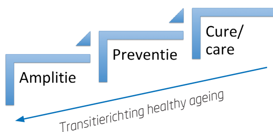
Figuur 1 - Copyright Paul Beenen