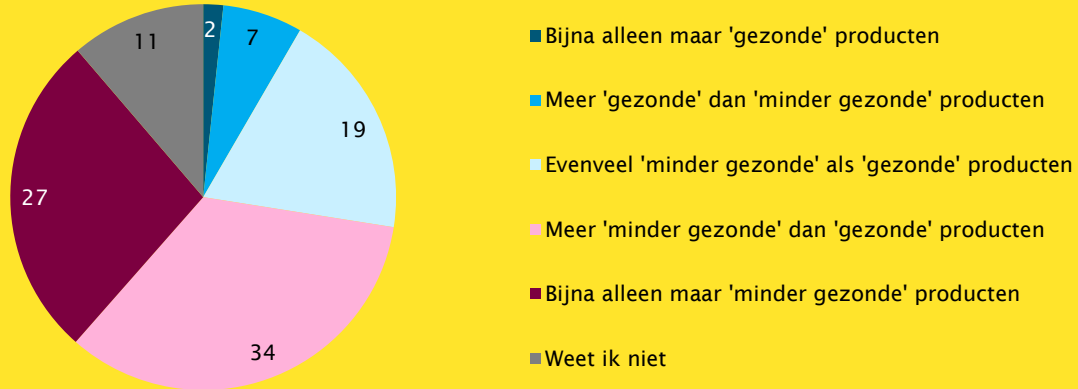
Figuur 2. Verhouding van het aanbod 'gezonde' en 'minder gezonde' producten in de kantine/horeca volgens verenigingsbestuurders van sportverenigingen met een eigen kantine/horeca in 2019 (in procenten, n=324)